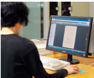
写真2 「デジタルコレクション」利用イメージ