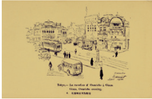
絵葉書「尾張町交差点附近」