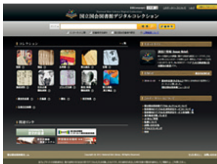
写真1 「デジタルコレクション」トップページ