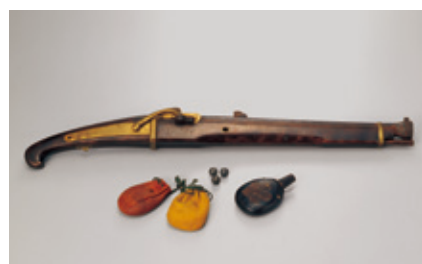
馬上で射撃できる火縄銃