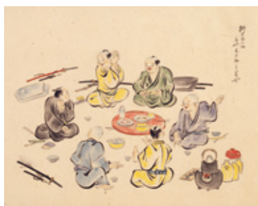
国元離れて江戸勤番 たまには気のおけない仲間と酒の語らい

久留米藩士江戸勤番長屋絵巻 酒宴の図 三谷勝波筆/戸田熊次郎序 明治時代 資料番号 86200129 [展示期間: 10月6日まで。以降は複製を展示]