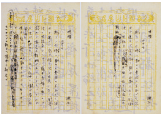
夏目漱石「明暗」反故草稿 夏目漱石筆 1916年(大正5) 資料番号 02303491