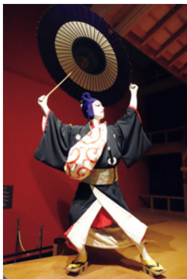
唐草模様の風呂敷でのインスタレーション

2018年秋、東京都はパリ市庁舎前広場に大きな風呂敷包みのパビリオンを設置し、風呂敷の展示やインスタレーション、ワークショップを通して風呂敷の魅力の世界に発信しました。その報告展として、江戸東京博物館と分館の江戸東京たてももの園では、パリーで展示された31人のアーティスト等によるオリジナル風呂敷を全点公開する特集展示「FUROSHIKI TOKYO」展を開催しました（本館…7月23日～8月25日、分館…7月23日～9月29日）。 会期中、常設展示室5階「助六の舞台」では、パリ市庁舎壁面の石像を彩ったものと同じ唐草模様の風呂敷でインスタレーションを行いました。いつもと少し異なる助六の姿に驚かれた方もいらしたかもしれません。 また、本館・分館ともワークショップを実施し、繰り返し使え、便利な風呂敷で箱や瓶など様々なものを包む体験をしていただきました。「意外に簡単」「暮らしの中で使ってみようと思う」との感想が印象的で、より身近に親しんでいただく機会となりました。 当館は、今後も多彩で魅力的な博物館活動を展開してまいります。どうぞご期待ください。