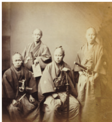
見よこの凛としたたぎまいこれぞサムライ!