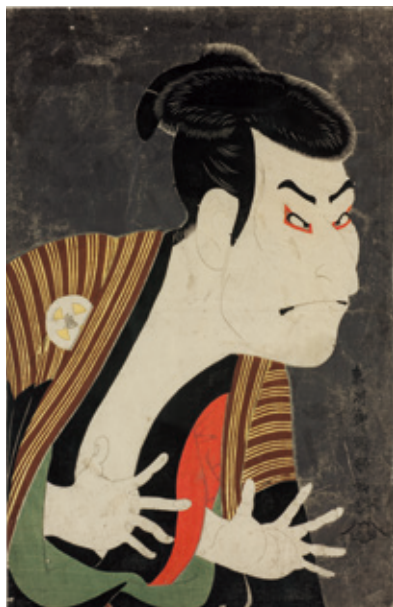
Royal Museums of Art and History, Brussels

歌川広重「東海道五拾三次之内 蒲原夜之雪」 1834～36年(天保5～7)頃 ミネアポリス美術館蔵 【11月19日(火)～12月15日(日) 展示予定】 ※展示期間については、変更となる場合があります。