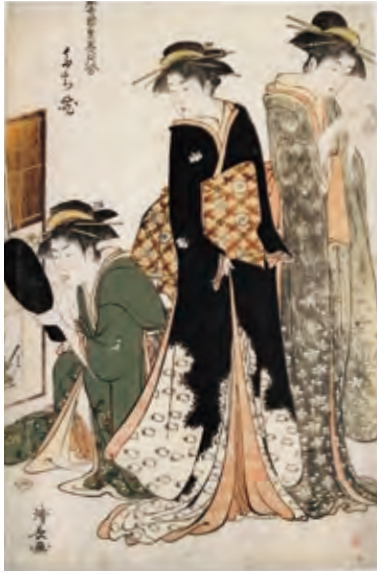
当世遊里美人合 たち花 鳥居清長/画 1782-84年(天明2-4)頃 資料番号 89204074

した18世紀後期の天明く寛政期(1781く1800年)、浮世絵の世界は、鳥居清長、喜多川歌麿、東洲斎写楽が活躍し、創造的なエネルギーに満ちていました。しかし当時の社会は、天明の大飢饉や物価の高騰が起こり、田沼意次の積極的な商業政策が終焉を迎えた時代でした。松平定信による寛政の改革が始まり、江戸の開放感と活気に影を落とし始めていました。その社会情勢の中、育まれた「いき」を2作品の浮世絵から読み取っていきます。