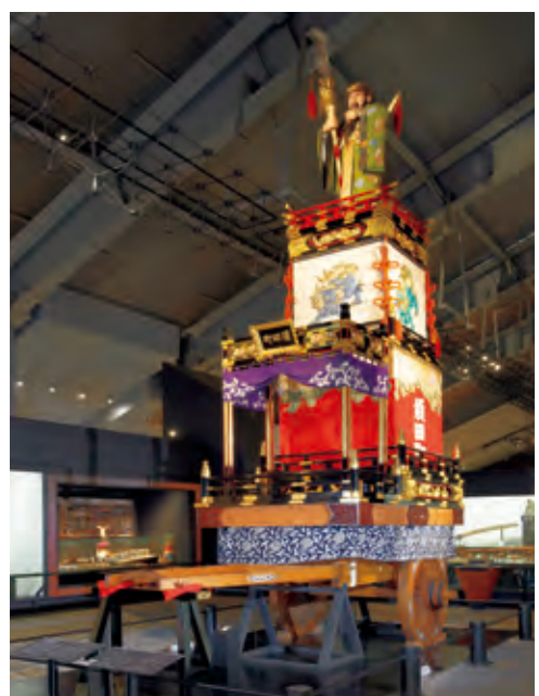
神田明神山車 復元年代:江戸末期