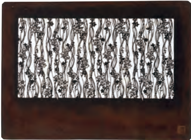
長板中形型紙 桔梗によるけ縞 資料番号 05003180