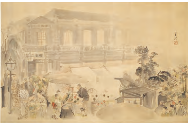
銀座煉瓦街中央新聞社前賑わいの図

イギリスのネオ・クラシックと呼ばれる様式をとるが、この様式は当時のイギリスの植民地で広く