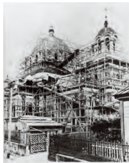
関東大震災写真帖 ニコライ堂 1923年(大正12) 資料番号 89000122

使われており、設計したアイルランド人ウォートルスは、大英帝国の植民地様式を自分もちやんと実現できることを誇示しなかった。なぜそんな意図をもったかという、彼の本業は鉾山技師であり、当時のヨーロッパ社会では鉾山技師より建築家の方が格上と見られており、せめて日本では格上の建築家として働きたかったのだろう。 つぎに、〈鹿鳴館〉は屋根に見られるフランス系様式とヴェランダという植民地様式をベースとするが、ヴェランダの列柱には椰子の樹の姿を、室内