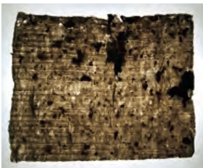
透過光撮影したもの。ほぐせていない紙の塊、漉きかたのあとがよくわかります。

ます。このような生活に密着したものは、捨てられてしまうことが多く、今に伝わるこの資料はとても貴重です。 (学芸員 白井麻美)