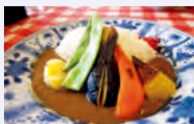
三笠會館 グリル野菜のカレー (野菜は季節によって変わります。)

当館1階レストラン「銀座洋食 三笠會館」では、人気メニュー「グリル野菜のカレー」を「染付芙蓉手VOC字文皿」を再現したお皿でご提供しています。お食事とともにぜひ文様もお楽しみください。