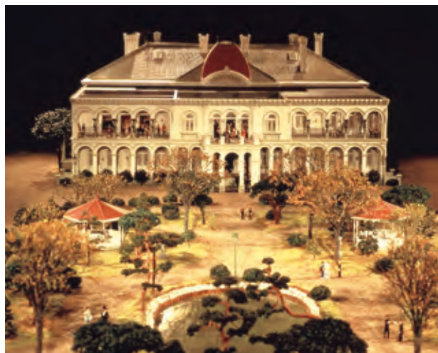
鹿鳴館 復元年代:1885年(明治18)11月