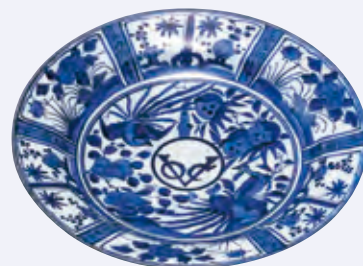
染付芙蓉手VOC字文皿 江戸中期 資料番号 95201624