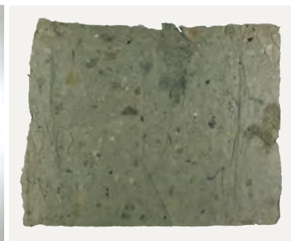
浅草紙 資料番号 95004694