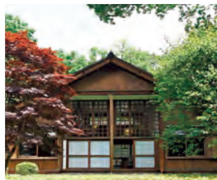
耐震補強工事後の前川國男邸