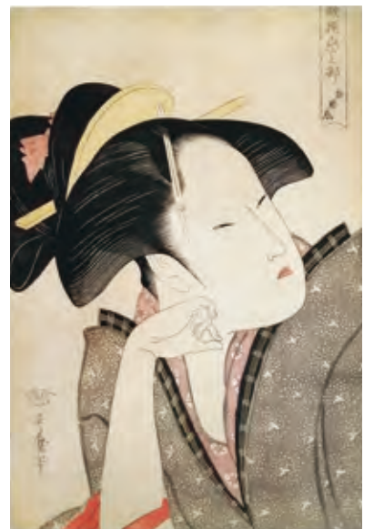
歌撰恋之部 物思恋 喜多川歌麿/画 1793年(寛政5)頃 資料番号 16200003

頬杖をつき遠くを見やりながら、ふと目を細める。「歌撰恋之部 物思恋」は、顔の表情や手の仕草で、心の内の動きを捉えた「美人大首絵」。喜多川歌麿による傑作です。無駄のないすつきりとした描線が、顔の表情に軽みと品を与えています。既婚を示す剃られた眉、庶民が結った「灯籠髷」の字髷は、町屋の女房であることを表しています。