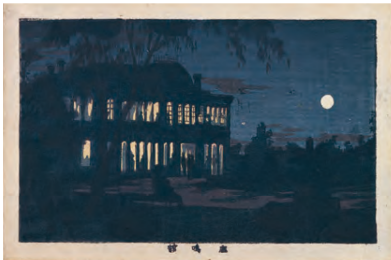
東京真画名所図解 鹿鳴館 井上安治/画 明治前期 資料番号 85200748

使われており、設計したアイルランド人ウォートルスは、大英帝国の植民地様式を自分もちやんと実現できることを誇示しなかった。なぜそんな意図をもったかという、彼の本業は鉾山技師であり、当時のヨーロッパ社会では鉾山技師より建築家の方が格上と見られており、せめて日本では格上の建築家として働きたかったのだろう。 つぎに、〈鹿鳴館〉は屋根に見られるフランス系様式とヴェランダという植民地様式をベースとするが、ヴェランダの列柱には椰子の樹の姿を、室内