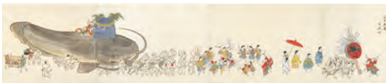
神田明神祭礼図巻 第二巻 横山窓/写 江戸時代後期 資料番号 96201316