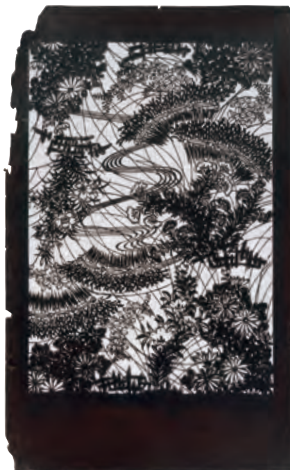
長板中形型紙 萩垣に秋草 資料番号 05003087

からは、江戸時代から昭和期にかけての型紙様式の変遷を追うことが期待できるが、今日まで本格的な調査は行われてこなかった。そこで今年度より本資料の調査を進め、主に型紙の製作年代の検証を始めることとした。 幕末期以降、海外からもたらされた化学染料や新しい技術によって、日本の染織文化は大きな転換期を迎える。そうした変化の中で、型染は江戸時代以来の技術をどのように発展させていったのであろうか。今後の資料調査にご期待いただきたい。